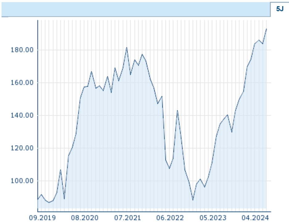
Die Wertentwicklung der Vergangenheit lässt keine verlässlichen Rückschlüsse auf die zukünftige Entwicklung eines Finanzinstruments zu.