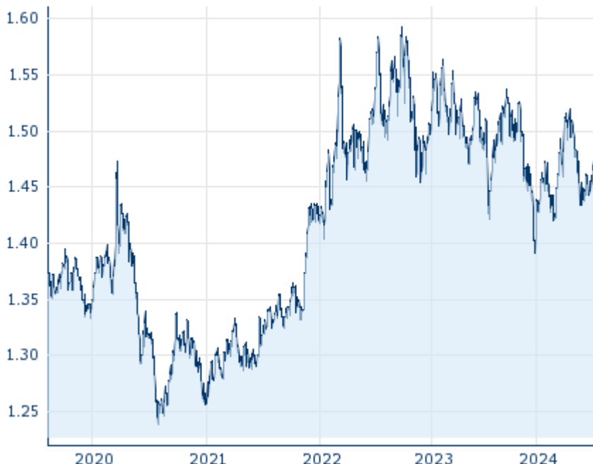
Die Wertentwicklung der Vergangenheit lässt keine verlässlichen Rückschlüsse auf die zukünftige Entwicklung eines Finanzinstruments zu.