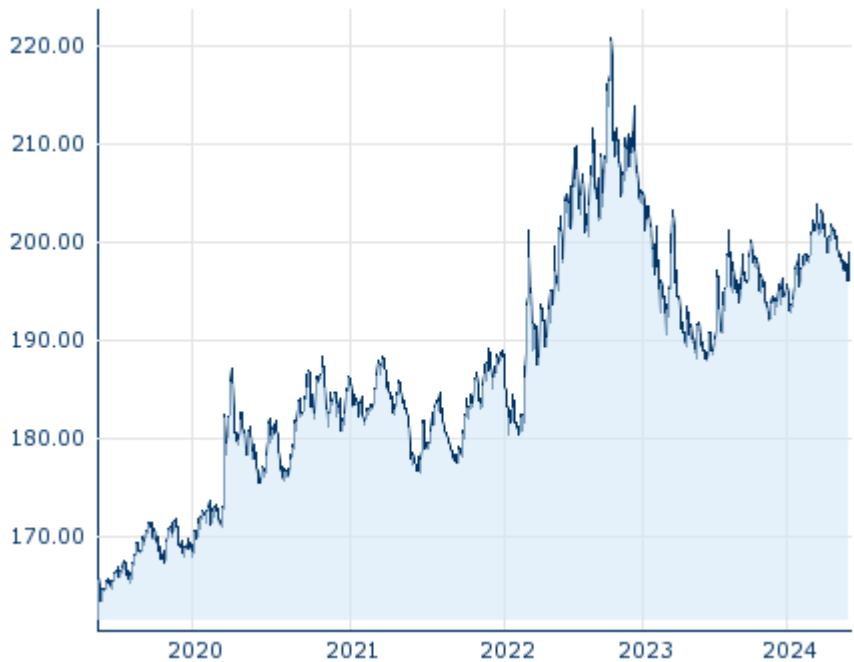
Die Wertentwicklung der Vergangenheit lässt keine verlässlichen Rückschlüsse auf die zukünftige Entwicklung eines Finanzinstruments zu.