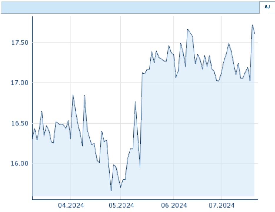
Die Wertentwicklung der Vergangenheit lässt keine verlässlichen Rückschlüsse auf die zukünftige Entwicklung eines Finanzinstruments zu.