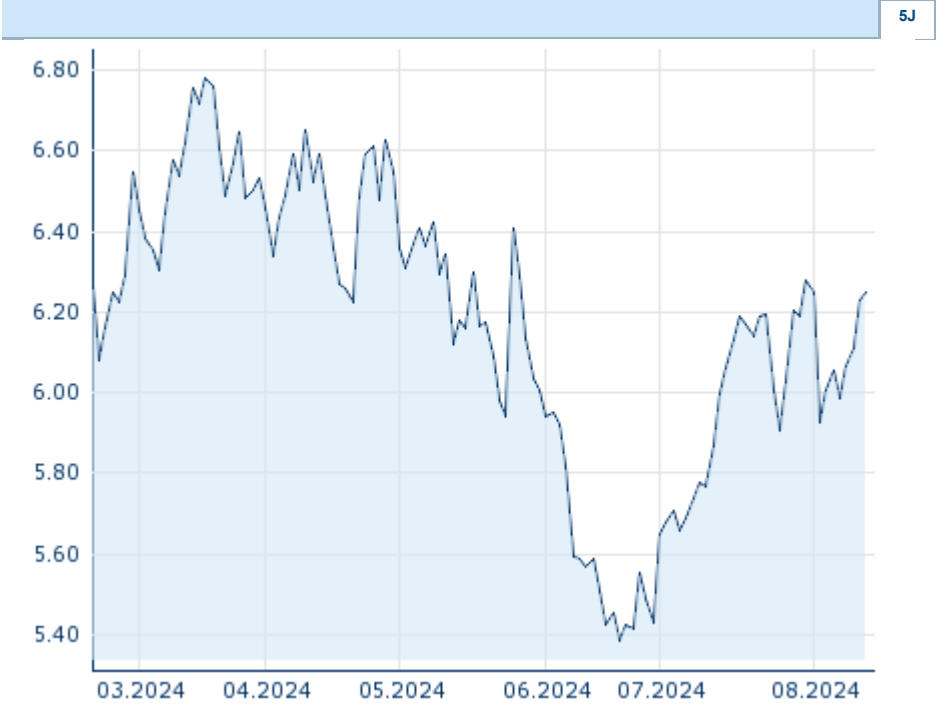
Die Wertentwicklung der Vergangenheit lässt keine verlässlichen Rückschlüsse auf die zukünftige Entwicklung eines Finanzinstruments zu.