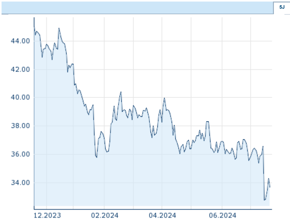
Die Wertentwicklung der Vergangenheit lässt keine verlässlichen Rückschlüsse auf die zukünftige Entwicklung eines Finanzinstruments zu.