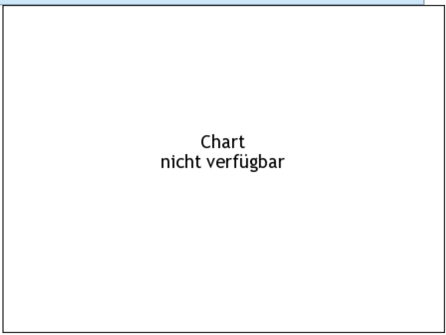
Chart nicht verfügbar

Die Wertentwicklung der Vergangenheit lässt keine verlässlichen Rückschlüsse auf die zukünftige Entwicklung eines Finanzinstruments zu.