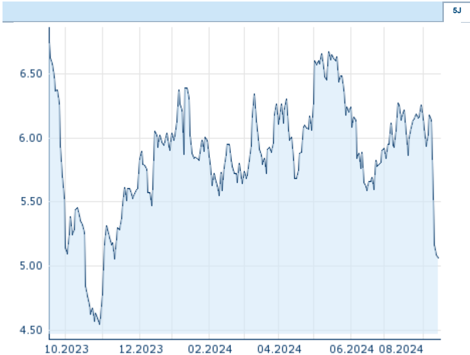
Die Wertentwicklung der Vergangenheit lässt keine verlässlichen Rückschlüsse auf die zukünftige Entwicklung eines Finanzinstruments zu.