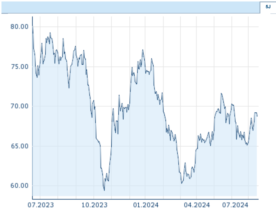
Die Wertentwicklung der Vergangenheit lässt keine verlässlichen Rückschlüsse auf die zukünftige Entwicklung eines Finanzinstruments zu.