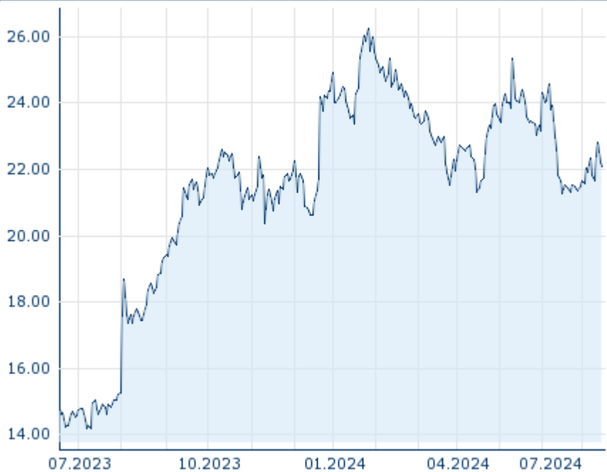
Die Wertentwicklung der Vergangenheit lässt keine verlässlichen Rückschlüsse auf die zukünftige Entwicklung eines Finanzinstruments zu.