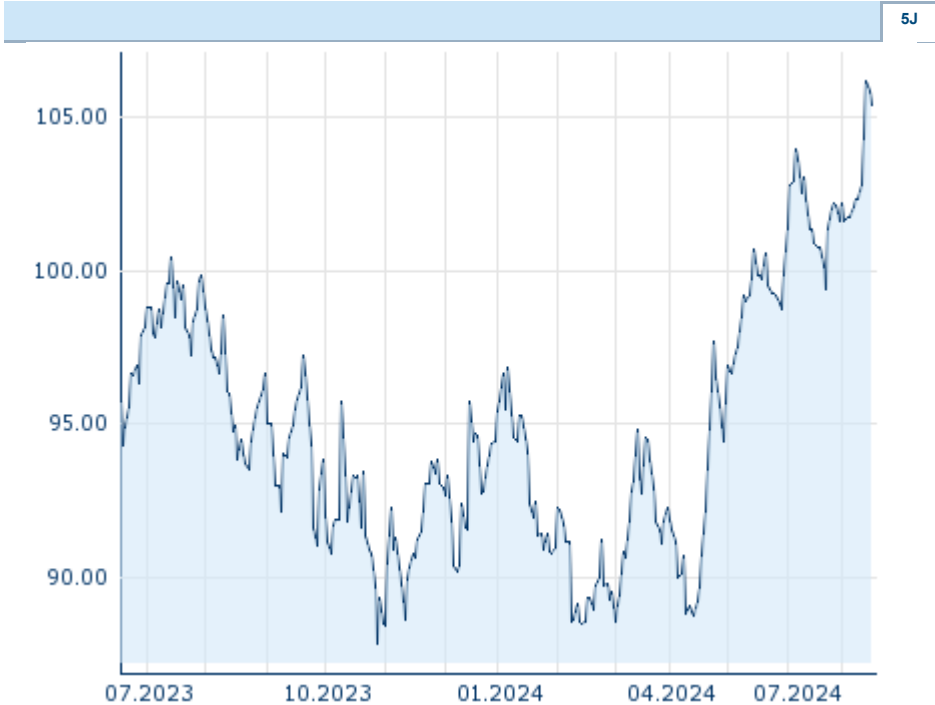
Die Wertentwicklung der Vergangenheit lässt keine verlässlichen Rückschlüsse auf die zukünftige Entwicklung eines Finanzinstruments zu. Quelle: FactSet