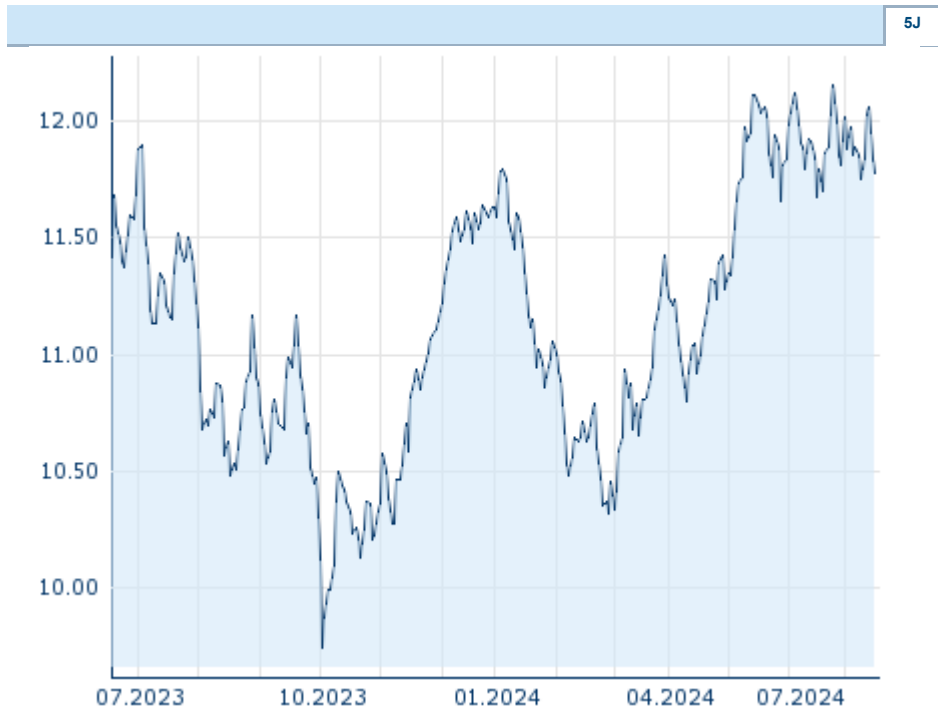
Die Wertentwicklung der Vergangenheit lässt keine verlässlichen Rückschlüsse auf die zukünftige Entwicklung eines Finanzinstruments zu.