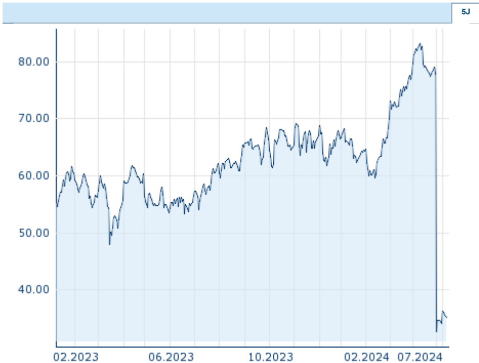
Die Wertentwicklung der Vergangenheit lässt keine verlässlichen Rückschlüsse auf die zukünftige Entwicklung eines Finanzinstruments zu.