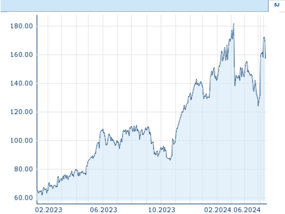
Die Wertentwicklung der Vergangenheit lässt keine verlässlichen Rückschlüsse auf die zukünftige Entwicklung eines Finanzinstruments zu. Quelle: FactSet