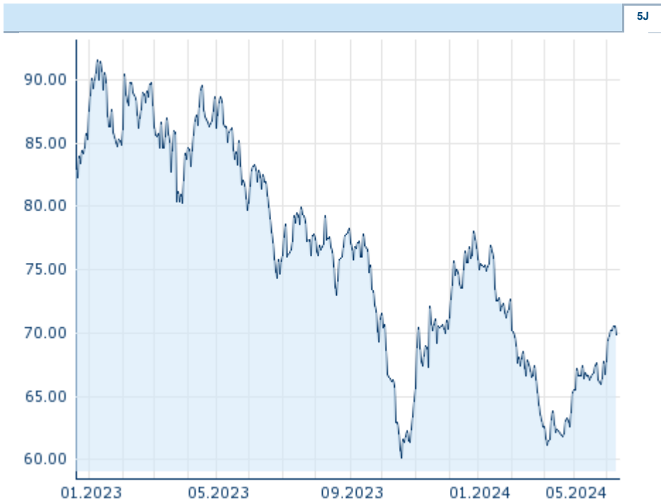
Die Wertentwicklung der Vergangenheit lässt keine verlässlichen Rückschlüsse auf die zukünftige Entwicklung eines Finanzinstruments zu.