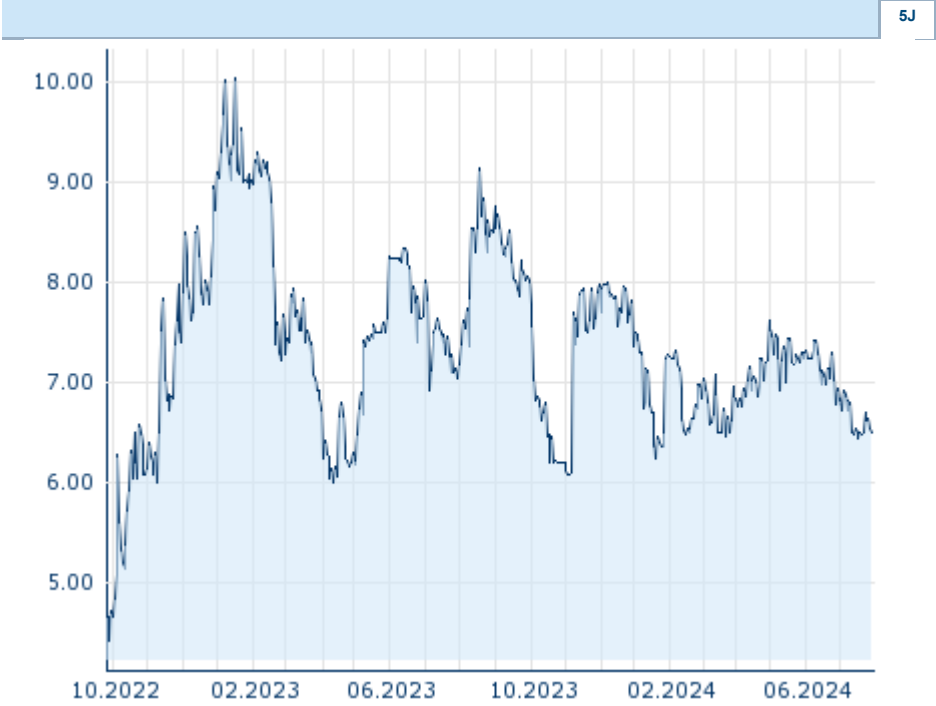
Die Wertentwicklung der Vergangenheit lässt keine verlässlichen Rückschlüsse auf die zukünftige Entwicklung eines Finanzinstruments zu. Quelle: FactSet