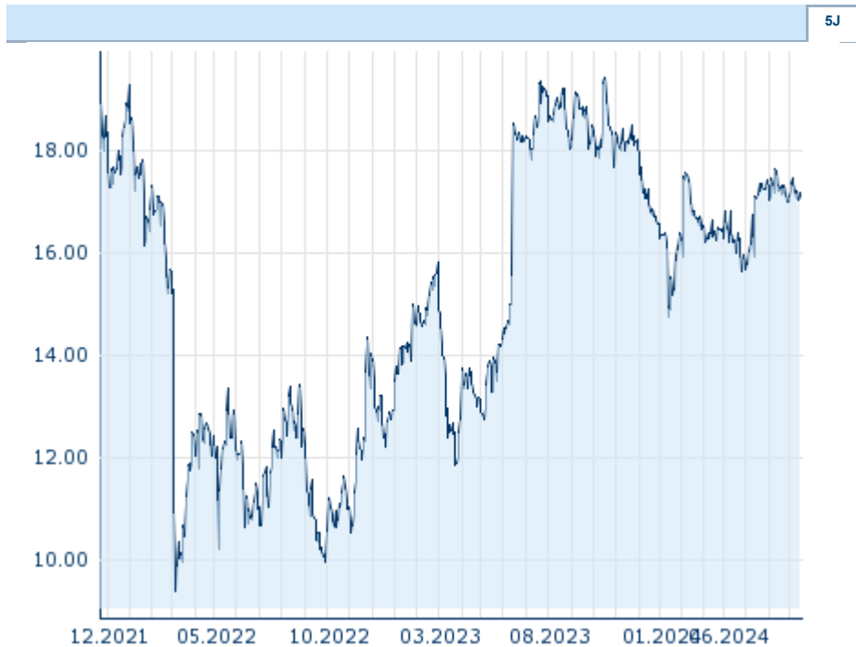
Die Wertentwicklung der Vergangenheit lässt keine verlässlichen Rückschlüsse auf die zukünftige Entwicklung eines Finanzinstruments zu.