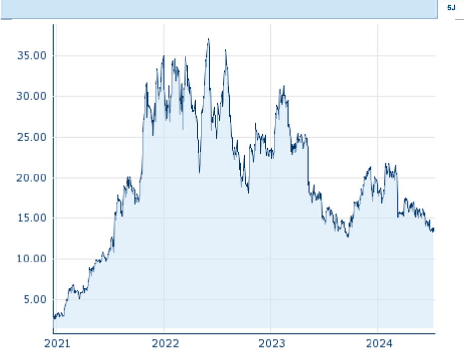
Die Wertentwicklung der Vergangenheit lässt keine verlässlichen Rückschlüsse auf die zukünftige Entwicklung eines Finanzinstruments zu.