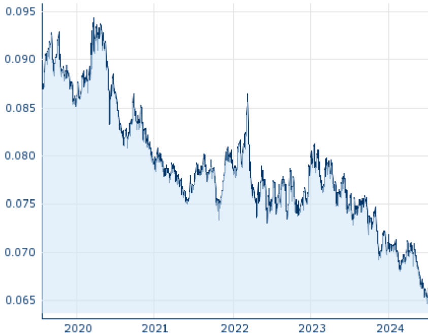
Die Wertentwicklung der Vergangenheit lässt keine verlässlichen Rückschlüsse auf die zukünftige Entwicklung eines Finanzinstruments zu.