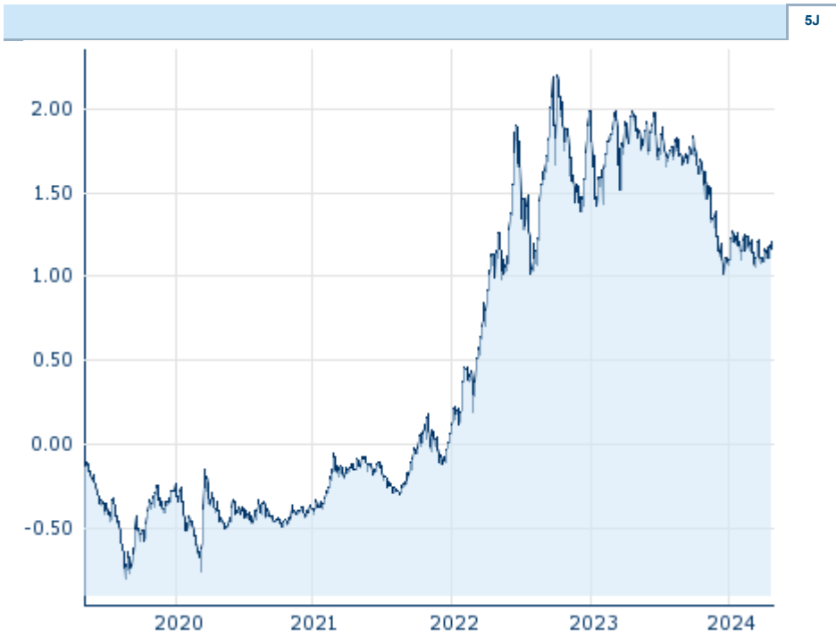
Die Wertentwicklung der Vergangenheit lässt keine verlässlichen Rückschlüsse auf die zukünftige Entwicklung eines Finanzinstruments zu.