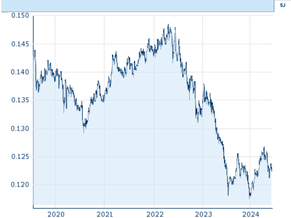
Die Wertentwicklung der Vergangenheit lässt keine verlässlichen Rückschlüsse auf die zukünftige Entwicklung eines Finanzinstruments zu.

Zugehörige Futures - Zugehörige Optionen -